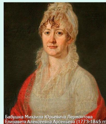
Бабушка Михаила Юрьевича Лермонтова Елизавета Алексеевна Арсеньева (1773-1845 гг.)