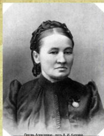
Мать Александра, мать А.И.Куприна

В круг детского чтения вошли произведения